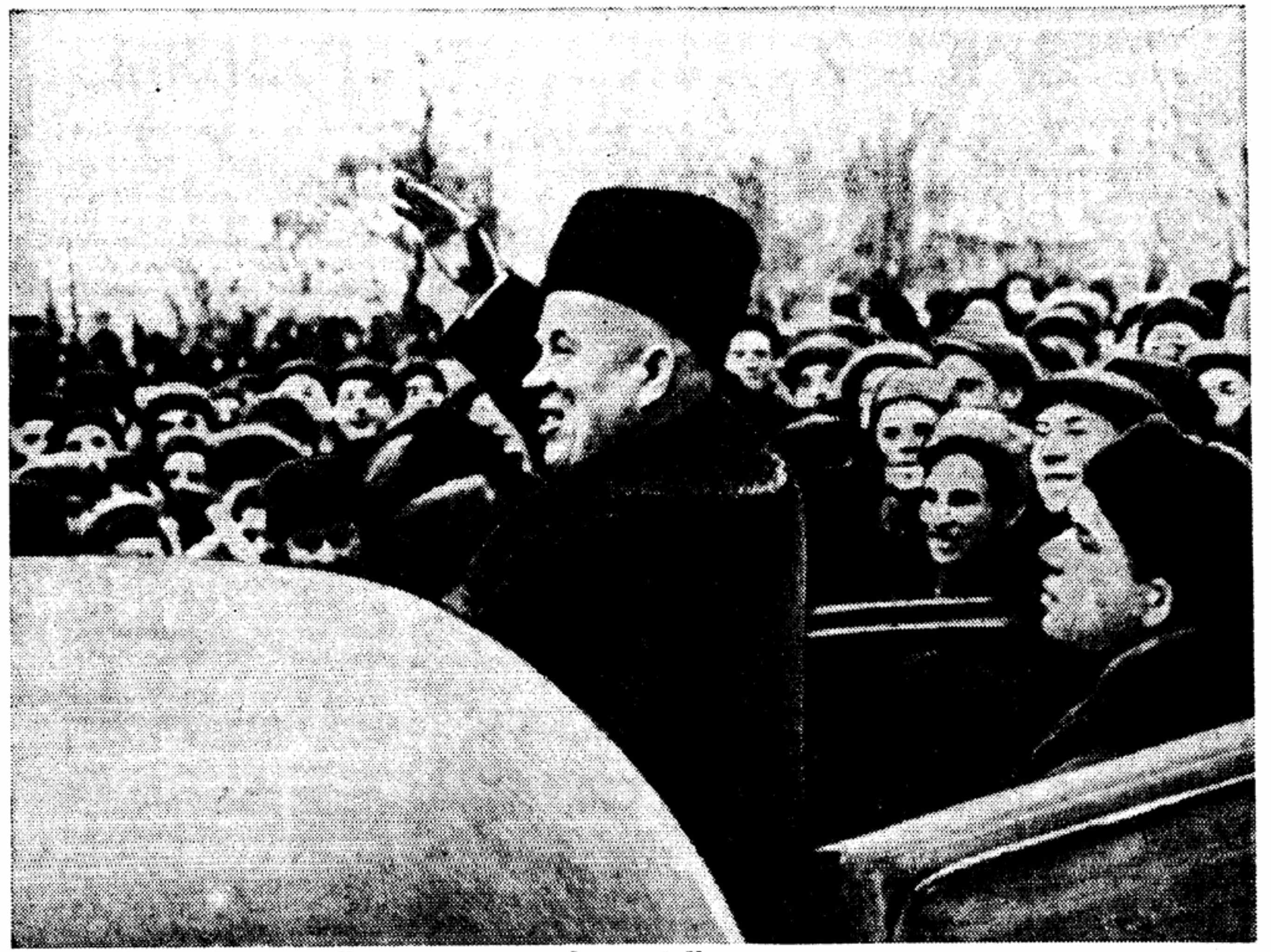
Приезд Никиты Сергеевича Хрущева в столицу Советской Украины