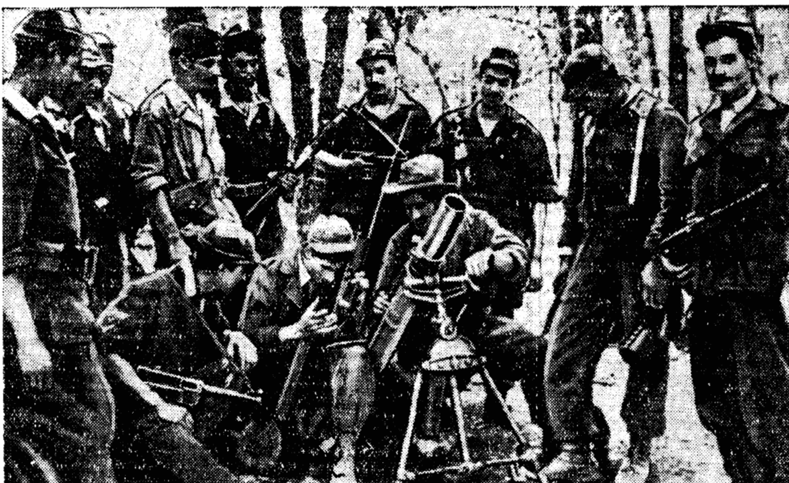
Обучение бойцов национально-освободительной армии Алжира. Вооружение армии состоит в основном из трофейного французского и американского оружия.

Я приветствую то сотрудничество, которое посланцы пробудившейся Азии и Африки, встретившись на конференции в Каире, соединят свои руки в крепком рукопожатии и добьются полного взаимопонимания в борьбе за мир и свободу.