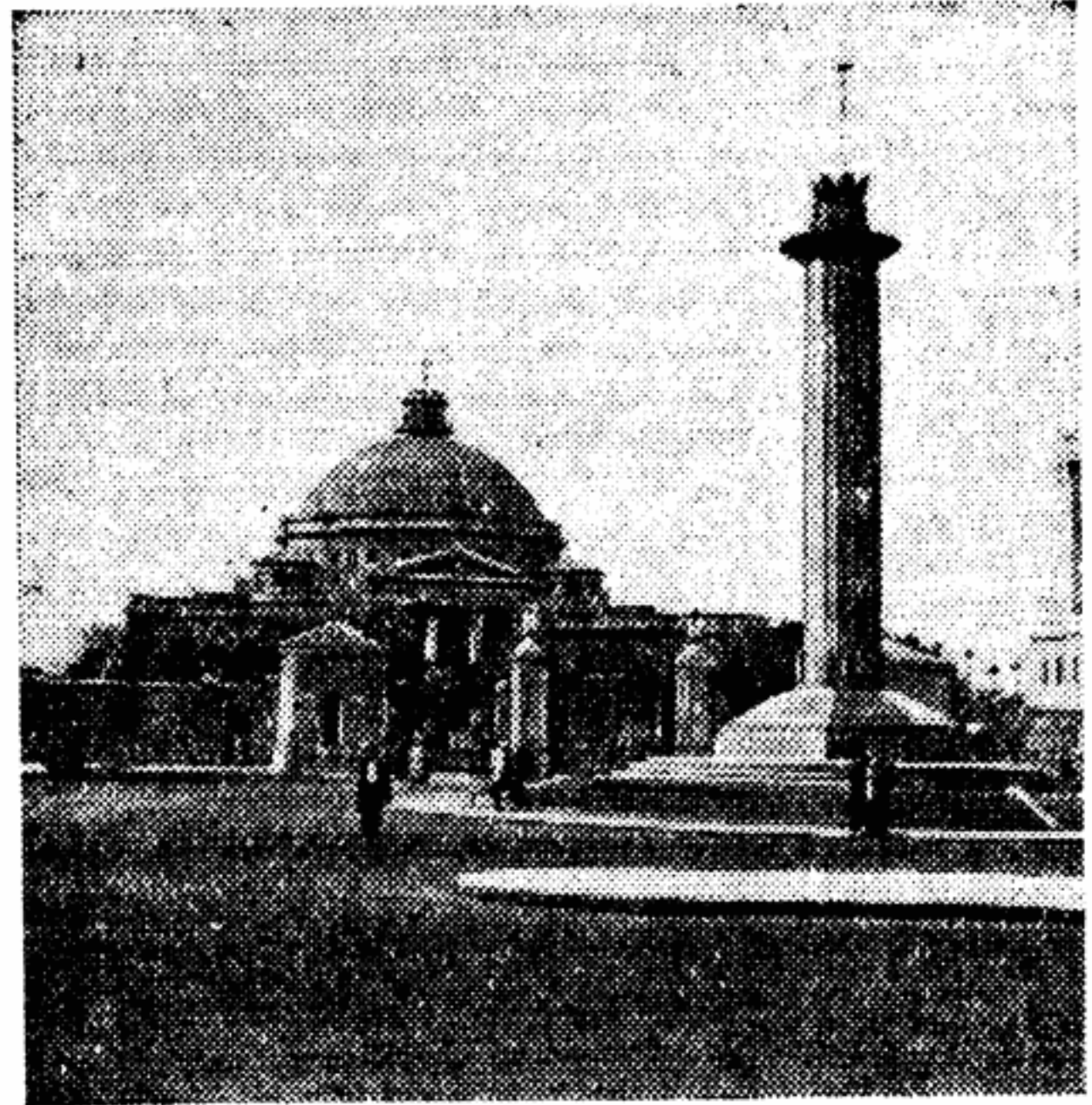
Здание Каирского университета. Здесь сегодня состоится торжественное открытие конференции солидарности стран Азии и Африки.

свою национальную независимость. Именно поэтому, что миролюбивые народы земного шара видят в нашей стране заступники и опорой своих национальных интересов, они так радуются достижениям нашей науки и техники, успехам в нашей хозяйственной и культурной жизни. Миллионы людей, в том числе народы Азии и Африки, наблюдают за советскими искусственными спутниками, видят в них спутников мира, радости и счастья. Вокруг этих добрых спутников, вокруг волнующих идей мира и дружбы объединяются все передовое человечество.