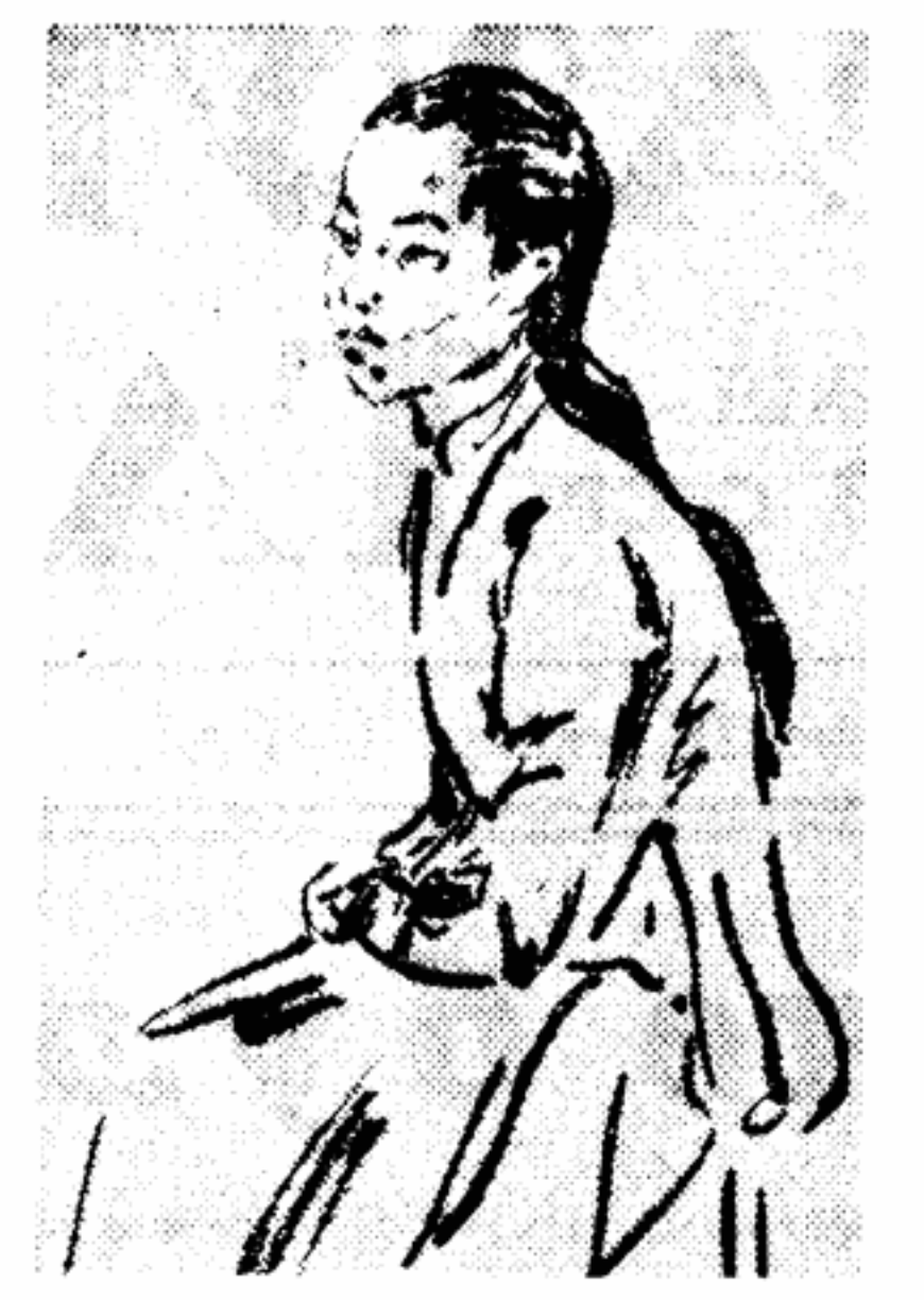
А. ДОРОХОВ. Девушка из Вьетнама (гуашь)

И. Лейзеров, — мы, участники этой поездки, очень благодарны художественной общественности Джакарты, Ханоя за ласковый и радушиный прием, оказанный нам. Мы благодарны и экипажу парохода «Илья Мечников», помогавшему студентам в выполнении творческих учебных заданий. Мы воспроизводим сегодня несколько репродукций работ студентов Института имени В. И. Сурикова, выполненных ими во время десятидневного плавания на пароходе «Илья Мечников».